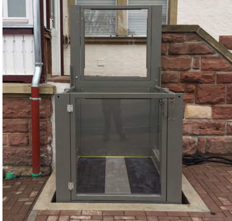
Installation in einer Grube mit Tür auf der Plattform