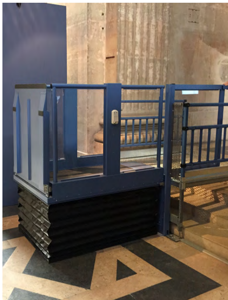
Auffahrrampe schliesst auf 1,1m Höhe über der Plattform formschön mit dem Geländer ab