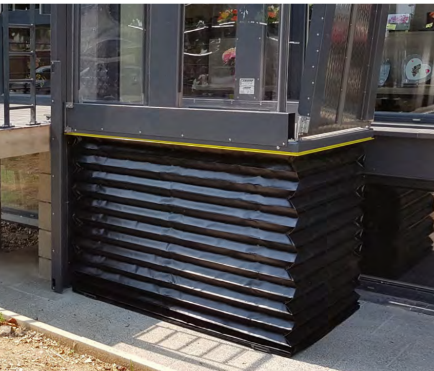
Faltenbalg und Kontaktleiste an allen 4 Seiten sorgen für höchste Sicherheit

Türen können manuel oder automatisch öffnen