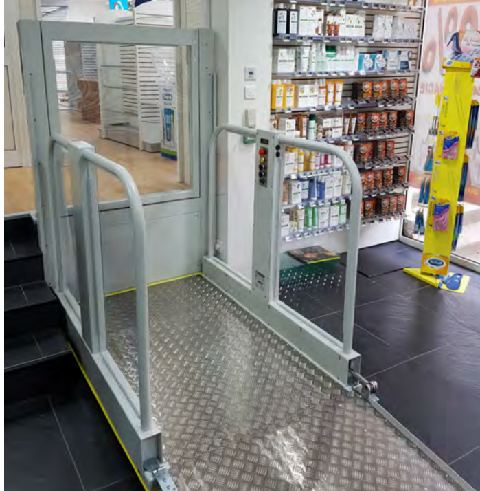
Anlage lieferbar in jeder beliebigen RAL Farbe (Standardfarbe RAL 7035)