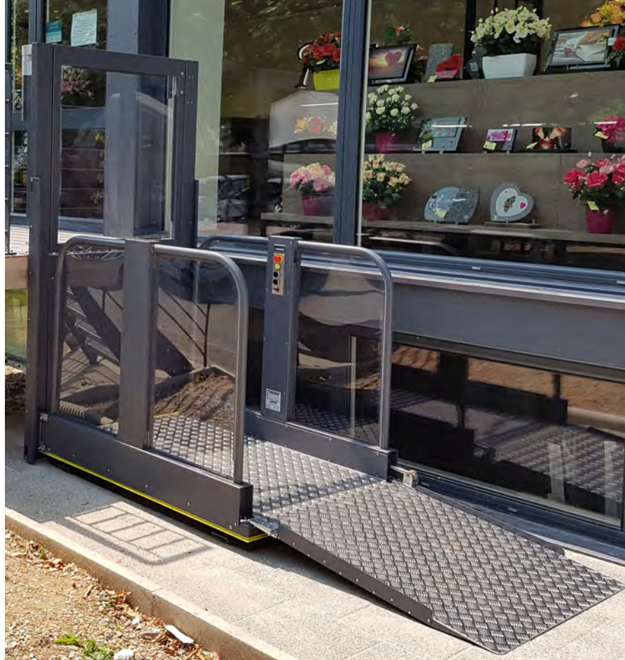
Einfache Auffahrt durch lange Auffahrrampe und geringe Plattformhöhe

Konzipiert für den Innen-, wie den Außenbereich, sorgt ein doppelter elektrischer Scherenhub und eine robuste Elektronik für einen wartungsarmen Betrieb.