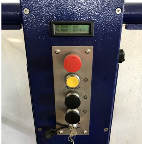
Steuerung auf Plattform mit Stop und Alarm Taster sowie Display für Status- und Fehleranzeige